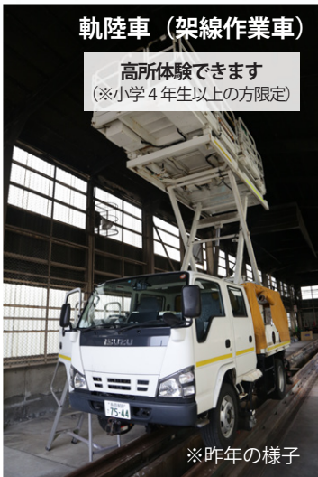
軌陸車(架線作業車)