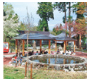
赤倉温泉 足湯公園