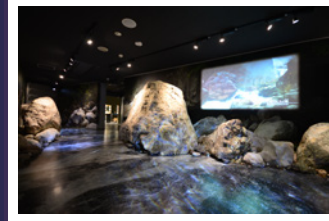
フォッサマグナミュージアム