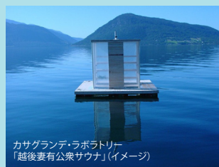
カサグランデ・ラボラトリー 「越後妻有公衆サウナ」(イメージ)