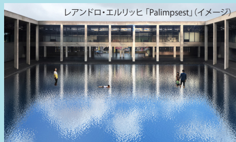
レアンドロ・エルリッヒ「Palimpsest」(イメージ)