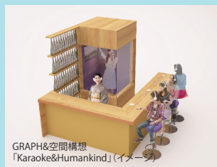
GRAPH&空間構想 「Karaoke&Humankind」(イメージ)

大地の芸術祭2018「2018年の<方丈記私記>」展 展示期間:2018年7月29日(日)~9月17日(月)