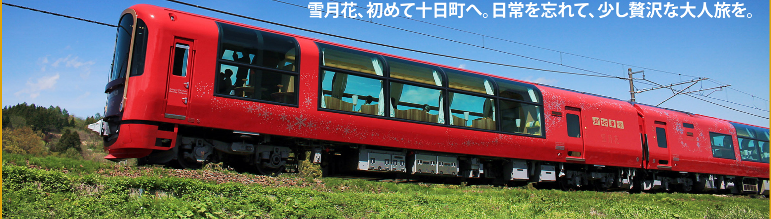
※画像は全てイメージです