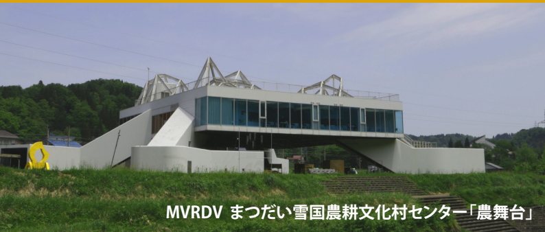
MVRDV まつだいい雪国農耕文化村センター「農舞台」