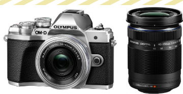
グランプリ オリンパス「OM-D E-M10 Mark III EZ ダブルズームキット」