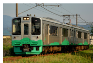
ET127 （妙高はねうまライン）（主に日本海ひすいライン）