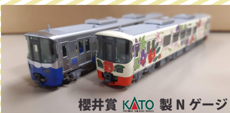
櫻井賞 KATO 製 N ゲージ

プロフィール：1954年、長野県出身のフォトジャーナリスト。両親ともに国鉄職員という環境から旅と鉄道を愛するようになり、一時は鉄道員を目指すも、鉄道写真の世界に心惹かれ、日本大学芸術学部写真学科を卒業。写真だけでなく国内外の鉄道や列車にまつわる数多くの著作も執筆している。