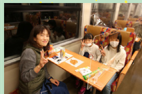
前回の様子 令和3年3月27日に 運行した際の様子です