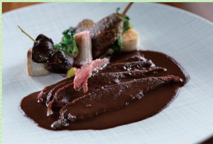
※玉城屋 お料理イメージ (当日は三段重でご提供します)