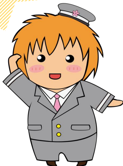
中郷区マスコットキャラクター・さとまる (駅員さんVer.)