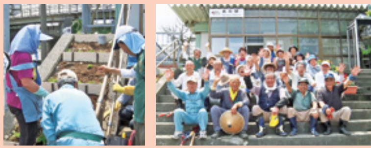
駅ホーム下を名立川が流れる

名立駅を中心に地域づくりに取り組む地元有志の団体。駅舎の美化活動や清掃活動をしたり、定期的にコンサートなどを開いたりしています。雪月花のおもてなしにも協力してくださっている心強い存在です。