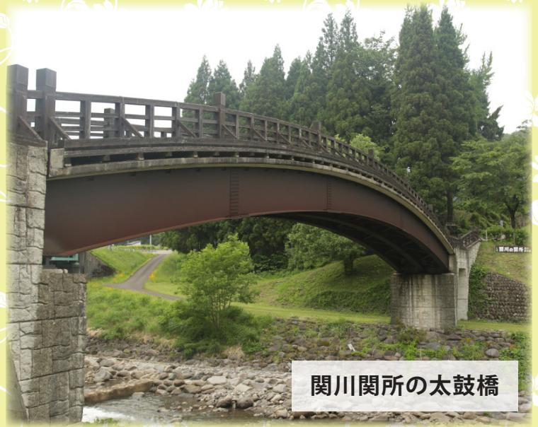
関川関所の太鼓橋