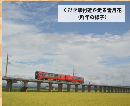
くびき駅付近を走る雪月花 (昨年の様子)

【泉質】ナトリウム・カルシウム—塩化物泉（高張性弱アルカリ性高温泉） 【効能】きりきず、末梢循環障害、冷え性、うつ状態、皮膚乾燥症（浴用）