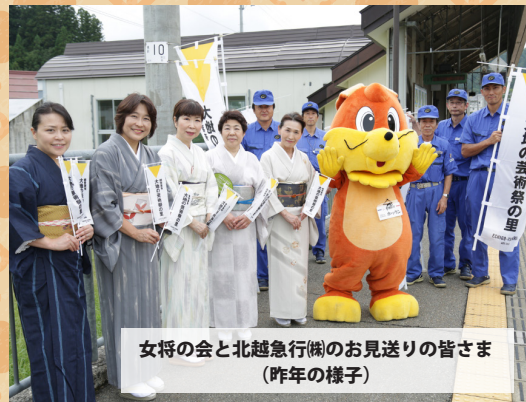
女将の会と北越急行(株)のお見送りの皆さま (昨年の様子)