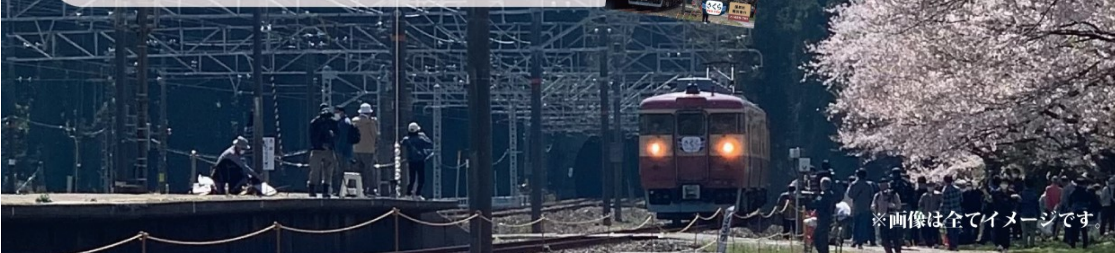
※画像は全てイメージです。